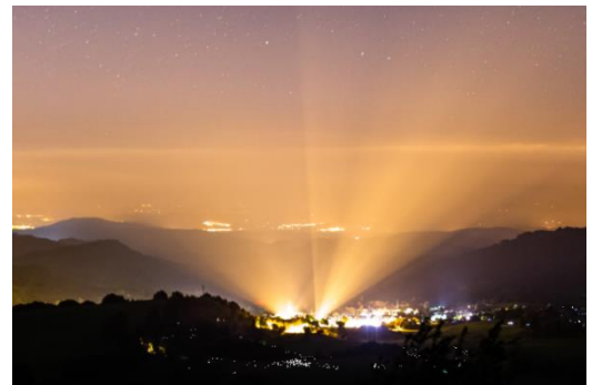
Pollution lumineuse

Pour réduire l'éclairage nocturne, ses impacts sur la biodiversité et faire des économies d'énergies, le Parc des Volcans d'Auvergne travaille à la définition d'une trame noire sur son territoire. Elle a pour objectif de maintenir et développer un réseau de continuités terrestres et aquatiques sans pollution lumineuse.